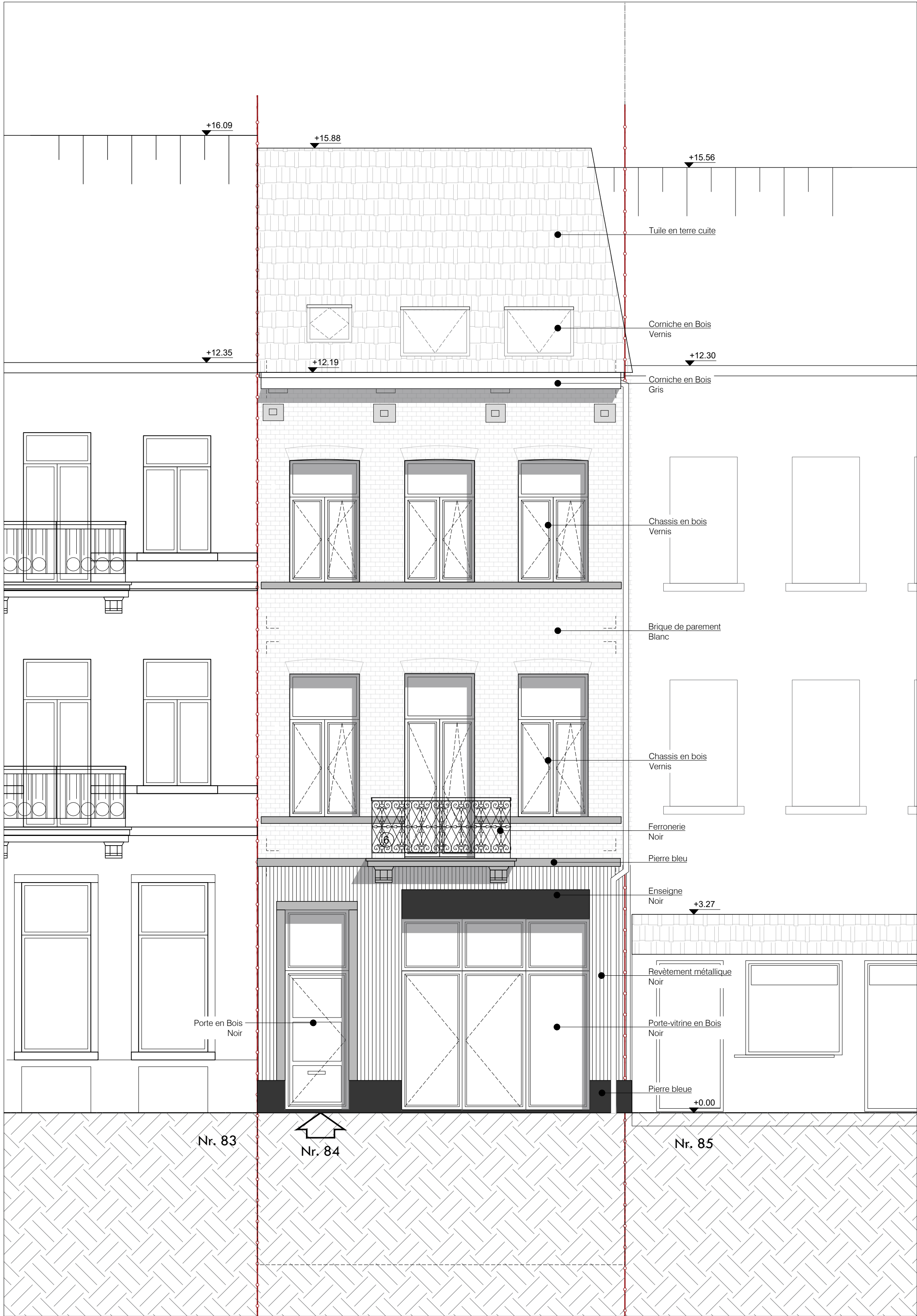
FAÇADE AVANT Ech: 1:50